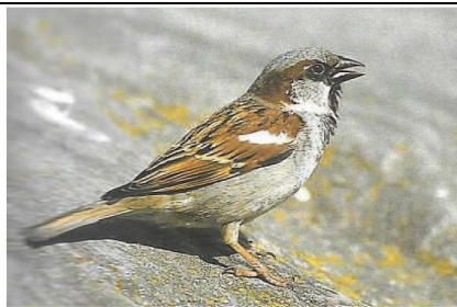
Slika 11: Domači vrabec (Vir: Eppinger in Hofmann, 2005)

Naredi si tabelico, ne potrebuješ lista, uporabi kar brezčrtni zvezek za okolje. Napiši si ime ptice (golob, vrabec, sinica, sraka, kos...). Lahko jo narišeš ali si prilepiš sliko, potem pa označiš kolikokrat si jo videl ali koliko ptic iste vrste si opazil. Veliko sreče pri opazovanju! 😊