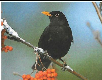
Slika 14: Kos