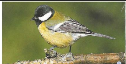
Slika 12: Velika sinica