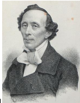
Hans Christian ANDERSEN

Mislite, da morajo imeti pravljice vedno srečne konce? Svoja razmišljanja nam lahko pošljete na zdraveljckova.posta@gmail.si Vesele bomo tudi risbic vaših najljubših pravljic.