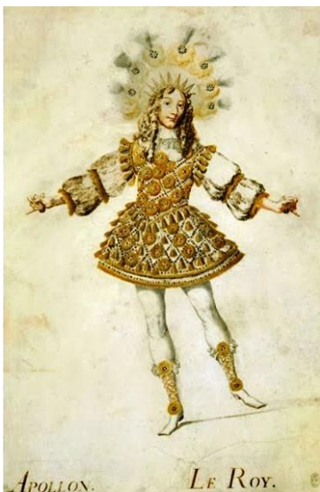
Ludvik XIV – Sončni kralj

1. april je znan kot dan norcev oziroma dan norčavosti. Ta dan si ljudje privoščijo šalo na tuj račun, s katero spravijo tistega, ki mu je šala namenjena in je ne spregleda, v zadrego. Ampak pošalite se lahko le do poldneva (uh ... koliko kaže takrat ura?) 😊 Če boste koga potegnili za nos, vseeno pazite, da ne bo šala škodoželjna.