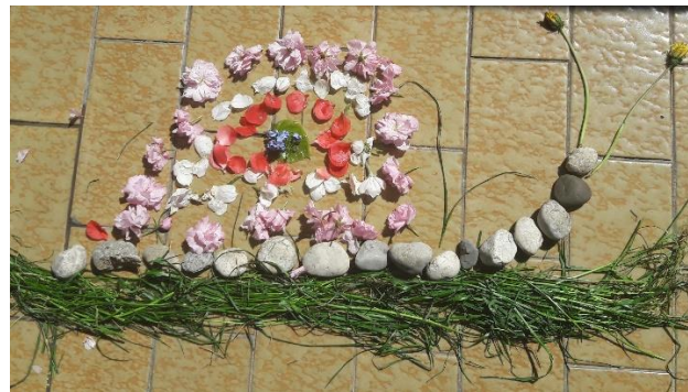
Nalov polž iz naravnega materiala

Še vedno zbiramo vaše izdelke na zdraveljckova.posta@gmail.com 😊