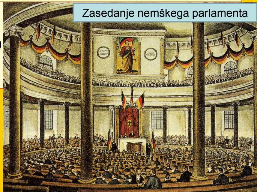
Zasedanje nemškega parlamenta